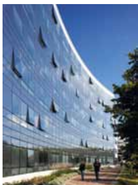
Architectes : ROUGERIE & HOUARD